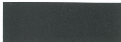
glimmerschwarz / black mica 0919