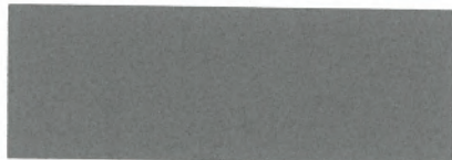
alugrau / aluminium grey 176 (DB 702)