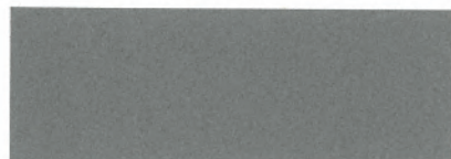
silbergrau / silver grey 106* (DB 704)