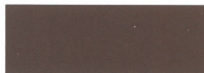
naturkupfer / natural copper 121*