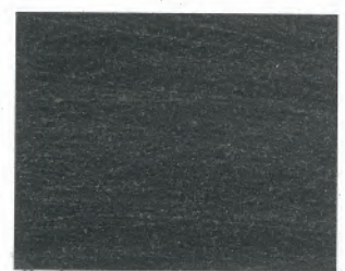
kunstschmiedeschwarz** durch Bürsten auf Eisenglanz aufgehellt

wrought-iron black mat** is easily brushable to iron gloss.