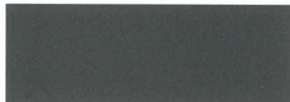
anthrazit / anthracite 156 (DB 703)