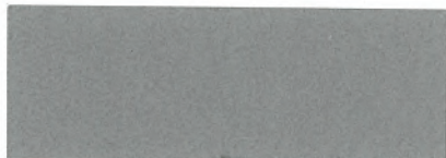
alugrau hell / light aluminium grey 177 (DB 701)

Standard-Farbtonkarte / Standard colour chart