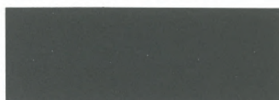
berchtesgadener grün / berchtesgaden green 130*