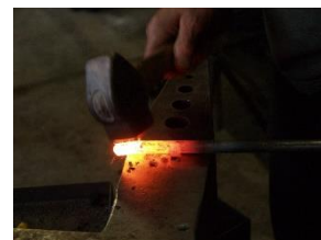
Eindrücke aus einem Schmiedekurs.

Mit Ihrer Anmeldung haben Sie unsere allgemeinen Geschäftsbedingungen sowie die folgenden Zusatzbedingungen anerkannt: